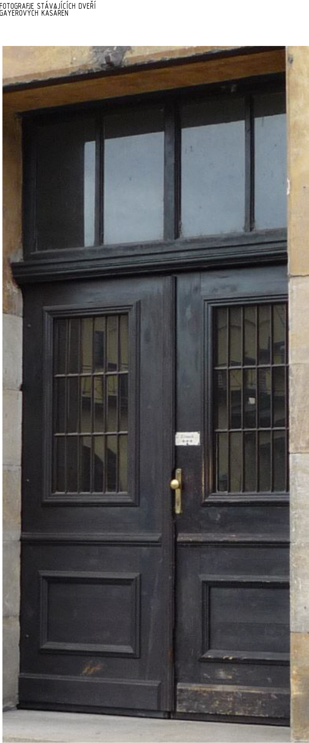
FOTOGRAFIE STÁVAJÍCÍCH DVEŘÍ GAYEROVÝCH KASÁREN

SPECIFIKACE: DVEŘE VSTUPNÍ ROZMĚRU 2000/2420 mm S NADSVĚTLÍKEM VÝŠKY 700 mm PRO OTVOR 2000/3220 mm DŘEVĚNÉ, MASIVNÍ, ŘEMESLNÉ HISTORICKÉ ZPRACOVÁNÍ, REPLIKA DLE PŮVODNÍCH DVEŘÍ Z GAYEROVÝCH KASÁREN KONSTRUKCE FASÁDNÍCH DVEŘÍ BUDE PROVEDENA ZE SYSTÉMOVÝCH PRVKŮ KONSTRUKCE BUDE PROVEDENA S OHLEDEM NA INTENZIVNOST POUŽÍVÁNÍ A DLE STANDARDNÍHO POŽADAVKU NA VSTUPNÍ DVEŘE DO OBJEKTU KŘÍDLA: CELODŘEVĚNÉ, TL. 50 mm OTOČNÉ, DVOUKŘÍDLOVÉ, HLAVNÍ KŘÍDLO LEVÉ, NADSVĚTLÍK, BEZ PRAHU PROSKLENÍ: FIXNÍ, ČIRÉ, BEZPEČNOSTNÍ SKLO KOVÁNÍ: 3 SYSTÉMOVÉ PANTY, BARVA STAROMOSAZ KLIKA/KLIKA, ZÁMEK ELEKTROMECHANICKÝ, PLNÝ ŠTÍTEK, KARTOVÝ SYSTÉM OBJEKTOVÉ KOVÁNÍ - PLNÝ ŠTÍTEK, BARVA STAROMOSAZ ZÁRUBEŇ: DŘEVĚNÁ RÁMOVÁ - MASIV, HLOUBKA 100 mm POVRCHOVÁ ÚPRAVA: KRYCÍ BARVA DLE STÁVAJÍCÍCH DŘEVĚNÝCH DVEŘNÍCH VÝPLNÍ GAYEROVÝCH KASÁREN, BARVA EXTERIÉR NCS 4550, EKOLOGICKÝ VODOU ŘEDITELNÝ LAK BAREVNÝ ODSTÍN, BUDE VZORKOVÁN A SCHVÁLEN PRACOVNÍKY PAMÁTKOVÉHO ÚSTAVU